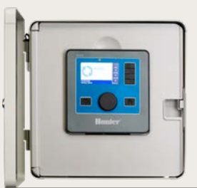
Metallgehäuse grau oder Edelstahl Höhe: 15.7" (40 cm) Breite: 15.7" (40 cm) Tiefe: 6.8" (18 cm)