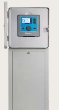
Metallsockel grau oder Edelstahl Höhe: 37" (94 cm) Breite: 15.5" (39 cm) Tiefe: 5" (13 cm)