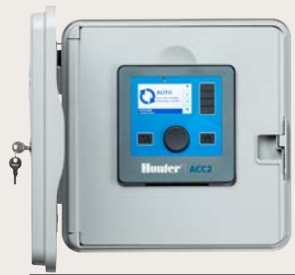
Kunststoffgehäuse für Wandmontage Höhe: 16.8" (43 cm) Breite: 16.8" (43 cm) Tiefe: 7" (18 cm)