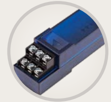
A2C-F3 Erweiterungsmodul für 3 Durchflussmesser