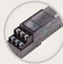
A2M-600 Erweiterungsmodul für 6 Stationen mit verbessertem Überspannungsschutz