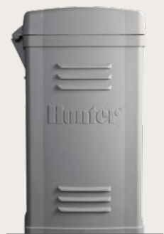
Kunststoffsockel Höhe: 39.5" (100 cm) Breite: 23.5" (60 cm) Tiefe: 17" (43 cm)